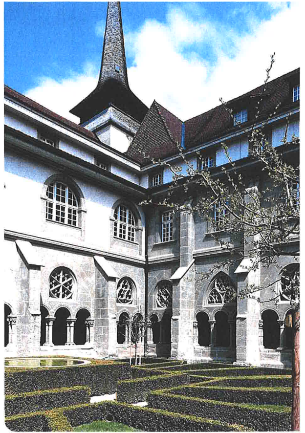
Le cloître de l'abbaye cistercienne d'Hauterive, près de Fribourg.