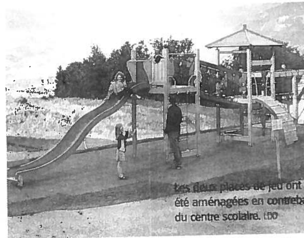
Les deux places de jeu ont été aménagées en contrebas du centre scolaire. LMT

places de jeu ont été aménagées. «L'une est destinée aux plus jeunes, l'autre aux plus grands. Ils pourront s'y amuser, notamment durant les récréations. Et les familles disposeront d'un espace de rencontre, ce qui manquait à notre village est assez dispersé.» Le terrain de sport par ailleurs été remis en état. Ces équipements ont coûté 78 000 francs. LMT