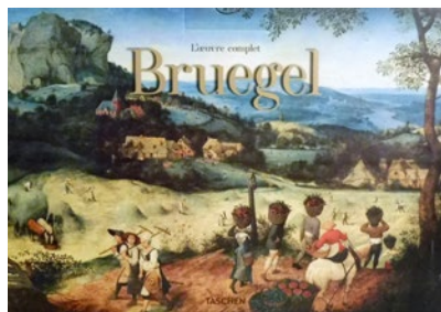
Bruegel Par Jürgen Müller et Thomas Schauerte Éditions Taschen

Un superbe coffret pour nous faire découvrir les caractéristiques de l'art de cet immense artiste. Le lecteur saura presque tout de ses fameuses estampes et de sa peinture qui a très rapidement séduit l'élite culturelle d'Anvers et de Bruxelles. Cette anthologie réunit 39 toiles, 65 dessins et 89 gravures qui témoignent à la fois des mœurs religieuses et de la culture populaire. Les reproductions sont somptueuses, le texte passionnant. Un livre qui est à lui seul presque une œuvre d'art. Cet ouvrage unique intéressera aussi bien les curieux que les amateurs éclairés.