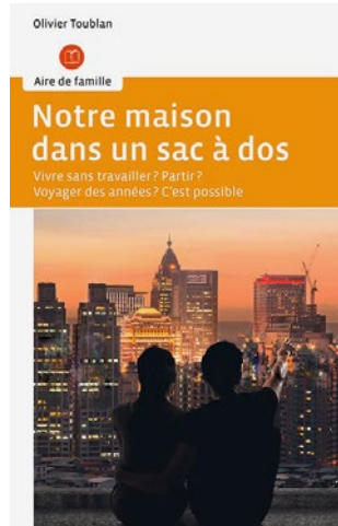
Notre maison dans un sac à dos Par Olivier Toublan Éditions Saint-Augustin

Olivier Toublan a été journaliste et rédacteur en chef. Un jour, après deux décennies de bons et loyaux services, cet amoureux des voyages et son épouse ont décidé de vivre leurs rêves, de changer de vie, de tout quitter et de partir à la découverte du monde. Le lecteur quant à lui, découvrira au fil des pages de ce livre passionnant comment s'y prendre concrètement aussi bien en ce qui concerne les formalités, le financement, les dépenses, comment lâcher prise, survivre en pays inconnu, gérer la logistique et aussi comment être heureux en couple lorsque l'on a opté pour cette nouvelle existence. Le lecteur découvrira aussi le Top Ten des merveilles qui ont interpellé les deux découvreurs. Passionnant et écrit, comme il se doit, de main de maître.