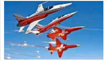
Fin octobre au-dessus de la Broye.